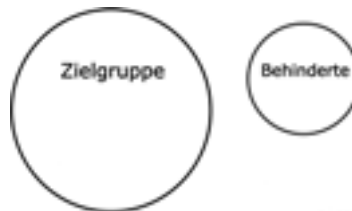
Abb. 2-6 Zielgruppenmissverständnis

Von Barrierefreiheit profitieren viele Menschen, denn neben der technischen Kompatibilität mit verschiedenen Endgeräten ist die Flexibilität der Webinhalte ein grundlegendes Prinzip der Barrierefreiheit. Webinhalte sollen unterschiedlichen Nutzerbedürfnissen und -vorlieben genügen und unterschiedlichen Konstellationen gerecht werden. So können auch Nutzer ohne Behinderung mit barrierefreien Angeboten besser umgehen, etwa wenn sie nicht auf dem neuesten Stand der Technik sind, zeitweise durch einen Unfall einen Computer nicht auf die gewohnte Weise bedienen können oder altersbedingte Schwierigkeiten bei der Computernutzung haben.