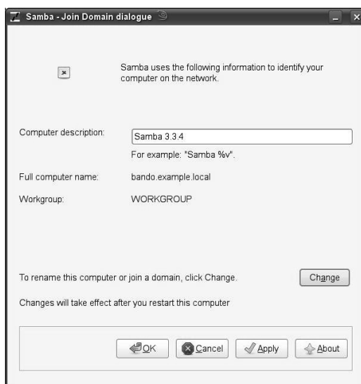
Abb. 36-1 Grafisches Join-Tool

Um nun der Domäne »EXAMPLE« beizutreten, klicken wir auf den Button »Change«, dann auf »Domain« und geben den Namen der Domäne ein, der wir beitreten möchten. Anschließend nur noch auf »OK« klicken, Namen und Passwort des Domänenadministrators eingeben und schon sind wir Domänenmitglied. Spätestens bei der Meldung, dass