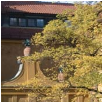
In dem chaotisch angeordneten Blätterwerk ist die schlechte Auflösung des Kamerasensors zu sehen. Die geometrischen Bildinhalte werden dagegen noch passabel abgebildet.