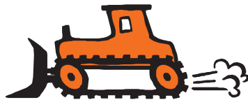
Abbildung 2.14 Destruktoren räumen nicht mehr benötigte Objekte auf.

Genauso wie es Methoden gibt, die bei der Erzeugung eines Objekts aufgerufen werden, gibt es auch welche, die bei seiner Vernichtung in Aktion treten.