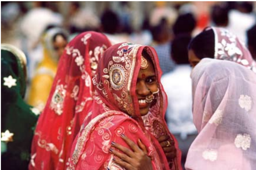
Oben: Farben und Formen machen dieses Bild der spielenden Mönchsschüler am Strand auf Sri Lanka spannend.

Meist gibt es Sprachbarrieren und in manchen Kulturen existieren religiöse Verhaltensregeln, die das Fotografieren erschweren oder erst gar nicht möglich machen. Sich hier-