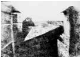
Abb. 6: »Blick aus dem Arbeitszimmer von Le Gras« von Joseph Nicéphore Niépce. Älteste erhaltene Fotografie von 1826, gemeinfrei

Der Begriff der »Fotografie« (ursprünglich »Photographie«) setzt sich aus dem altgriechischen »phōs« (im Genitiv »photós«), also »Licht«, und »graphein«, also »schreiben, malen« zusammen, und bedeutet insofern »Malen mit Licht«. Die Geschichte solchen »Lichtschreibens« begann im Grunde genommen schon im Griechenland der Antike. Aristoteles (384–322 v. Chr.) erkannte, dass das durch ein kleines Loch in einen abgedunkelten Raum einfallende Licht auf der gegenüberliegenden Wand ein auf dem Kopf stehendes Abbild der Außenwelt produziert. Ein vertieftes Verständnis dieses Prinzips verdanken wir Leonardo da Vinci (1452–1519), und ab dem 17. Jahrhundert war die »Camera obscura« in Form transportabler Kästen verfügbar, wie in Abb. 5 aufgezeigt.