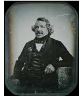
Abb. 7: »Porträt des Louis Daguerre« von Jean-Baptiste Sabatier-Blot, 1844, gemeinfrei

Schon im 19. Jahrhundert gab es erste Experimente mit der Farbdarstellung, doch standen diese anfangs noch vor erheblichen technischen Schwierigkeiten. Erst die Entwicklung eines (in der Regel dreifachen) Schichtaufbaus im Filmmaterial ab den 1930ern brachte den Durchbruch. Nach diesem noch heute gültigen Prinzip werden dabei unterschiedliche Spektren bzw. Sensibilisierungen unterschieden wie »unsensibilisiert« (ca. 350–450 nm, auf die Empfindlichkeit gegenüber Violett und Blau beschränkt), »orthochromatisch« (ca. 350–600 nm, zusätzlich zum Vorgenannten gegenüber Grün und Gelb empfindlich) sowie »panchromatisch« (ca. 350–799 nm, zusätzlich zum Vorgenannten gegenüber