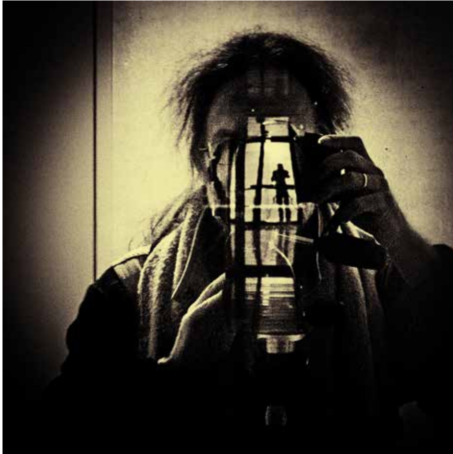
Abb. 4: Selbstporträt 2009. Der Blick durch die Kamera zeigt zunächst das äußerlich Sichtbare, ermöglicht zugleich aber auch einen Blick auf uns selbst, wie im nebenstehenden Bild durch die Spiegelung symbolisiert.

Weitere Überlegungen und auch einige praktische Übungen dazu finden sich in Unterkapitel 3.2, »Einstimmung vor Ort«.