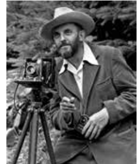
Abb. 12: Ansel Easton Adams auf einer Aufnahme von J. Malcolm Greany aus dem Jahr 1950, Public Domain

Ein Vergleich mit der musikalischen Aufführungspraxis