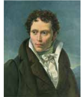
Abb. 2: Arthur Schopenhauer, porträtiert 1815 von Ludwig Sigismund Ruhl, gemeinfrei

Wir sehen, dass sich die verschiedenen wissenschaftlichen Disziplinen mit solchen Phänomenen schon ausführlich beschäftigt haben. Vonseiten der Anthropologie oder Soziologie wird das Verhältnis zwischen Mensch und Architektur als wichtiger Teil des sozialwissenschaftlichen Diskurses (etwa auf städteplanerischer Ebene) beschrieben. Des Weiteren erscheint die Architektur als ein kulturstiftendes Element, und dieser Begriff mag sich dem unmittelbaren