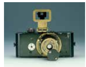
Abb. 9: Ur-Leica 1914, Quelle Leica Microsystems (früher Ernst-Leitz), CC-Lizenz