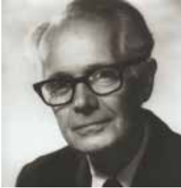
Abb. 3: Heinz Kohut, Fotograf und Entstehungsjahr unbekannt

Verständnis durchaus erschließen: Mit der Erschaffung der Architektur bewiese sich der Mensch als Kulturwesen; immerhin, denn angesichts allgegenwärtiger Ausbeutung, Not und Kriege auf dieser Welt mag man daran bisweilen zweifeln. Die Psychologie hingegen weist in diesen Zusammenhängen eher auf die selbstobjektale Bedeutung der Architektur hin. Dieser Begriff ist schon deutlich sperriger, weswegen ich ihn (von meiner psychotherapeutischen Warte aus) ein wenig erklären möchte.