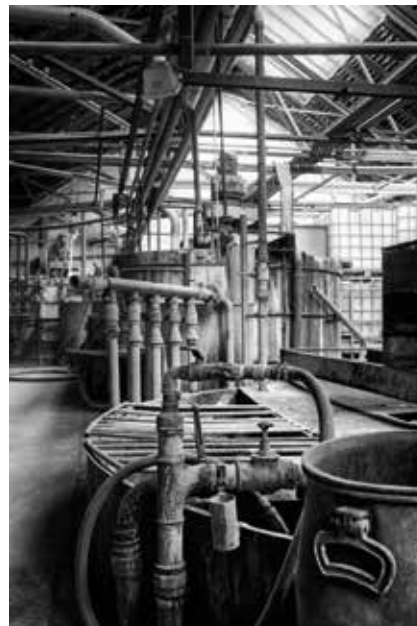
Abb. 13: Bruchsaler Farben | Studien 19a und b, links in einer Farbausarbeitung mit simulierter Crossentwicklung, rechts in einer Schwarzweißkonvertierung. Worin unterscheiden sich die beiden Aufnahmen, welche davon mag wohl die komplexen Strukturen und das innere Gefüge der Anlage besser wiederzugeben?