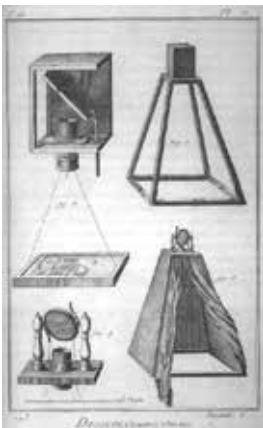
Abb. 5: Camera obscura, aus der französischen »Encyclopédie, ou dictionnaire raisonné des sciences, des arts et des métiers« von 1751, gemeinfrei